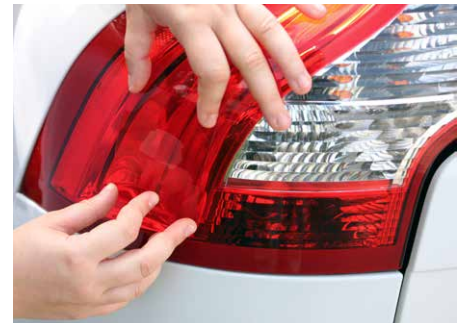
Monte el panel Kleben das Folie