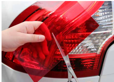
Corte el panel de reparación Schneiden Sie die Reparaturfolie