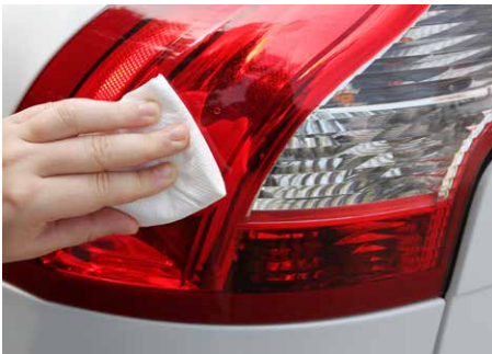
Limpe y mida Reinigen und Markieren

Falls dieser vor der Lichtquelle sitzende Diffusor durch die Stoßwirkung beschädigt wurde, lässt er sich durch die Reparaturfolie mit gemusterter Oberfläche ersetzen.